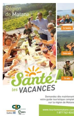
* Publicité – guide ATRG