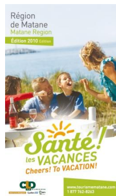
* Guide touristique 2010

Sous le thème « SANTÉ, les vacances », la nouvelle image et le nouveau slogan de la région de Matane représentent le plaisir en famille, la détente au bord de la mer, la qualité de vie et les bonnes tables. À l'occasion de l'ouverture officielle du Bureau d'accueil touristique le jeudi 10 juin 2010, le Guide touristique officiel et les publicités de la région ont été dévoilés. Les placements-média dans le Guide touristique de l'Association touristique régionale de la Gaspésie (ATRG) et la carte routière officielle 2010-2012 incitent les visiteurs à en apprendre davantage sur la région et ainsi, de constater la diversité des activités et des attraits.