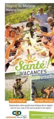
* Publicité – carte routière 2010-2012 de l'ATRG