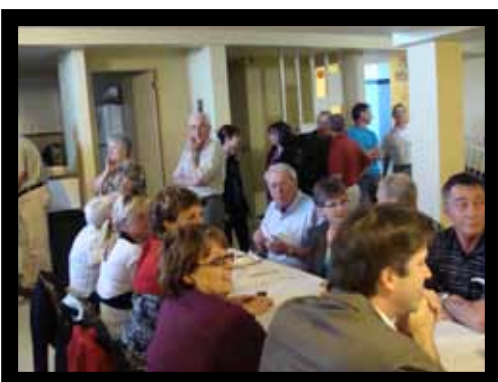
Le 5 à 7 rural qui s'était tenue à Grosses-Roches en 2010

Cette rencontre annuelle est l'occasion de présenter les projets retenus dans le cadre du Pacte rural, d'échanger et de rendre hommage aux bénévoles travaillant à l'amélioration de la qualité de vie de leur milieu. Puisque l'événement coïncide avec la Semaine de la municipalité et que sa thématique est celle de l'écoresponsabilité, le conférencier sera un représentant de la coopérative CONTACT, qui entretiendra les participants sur le développement durable. Cette jeune coopérative de la Gaspésie évolue dans trois domaines, le volet signature, qui est une usine de transformation de bois, tourné vers les produits écologiques, le volet innovation, qui anime un réseau de chercheurs tentant de développer de nouveaux produits, et le volet nature, un club de vacances où les gens peuvent acquérir de nouvelles connaissances pour adopter un comportement responsable.