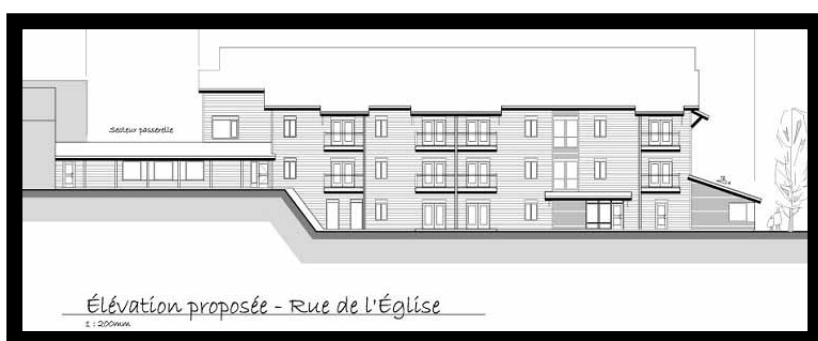
Un plan de la nouvelle résidence