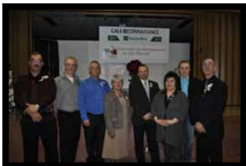
Le Comité organisateur