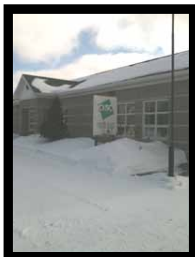
Le CLSC de Baie-des-Sables, un des nombreux points de services dans la MRC