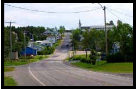
Le coeur villageois de Saint-Adelme

Le montant accordé par le programme est de 28 000 $ sur un total de 40 500 $ de dépenses budgétées.