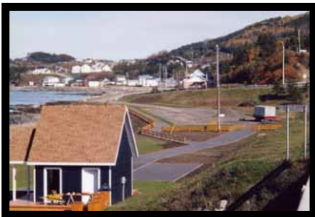
Le parc Vue sur la mer, lieu où sera implanté le parcours maritime de Les Méchins

voir apparaître sur le site du parc, 4 nouveaux panneaux d'histoires.